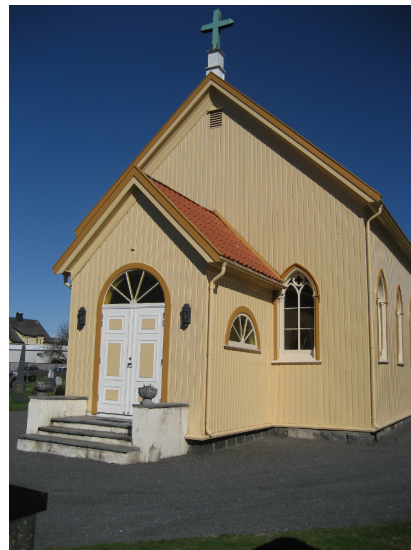
Søndagsskolen holdes i kapellet.

Denne høsten blir det søndagsskole 21. oktober, 11. november og 9. desember. 11. november får vi også besøk