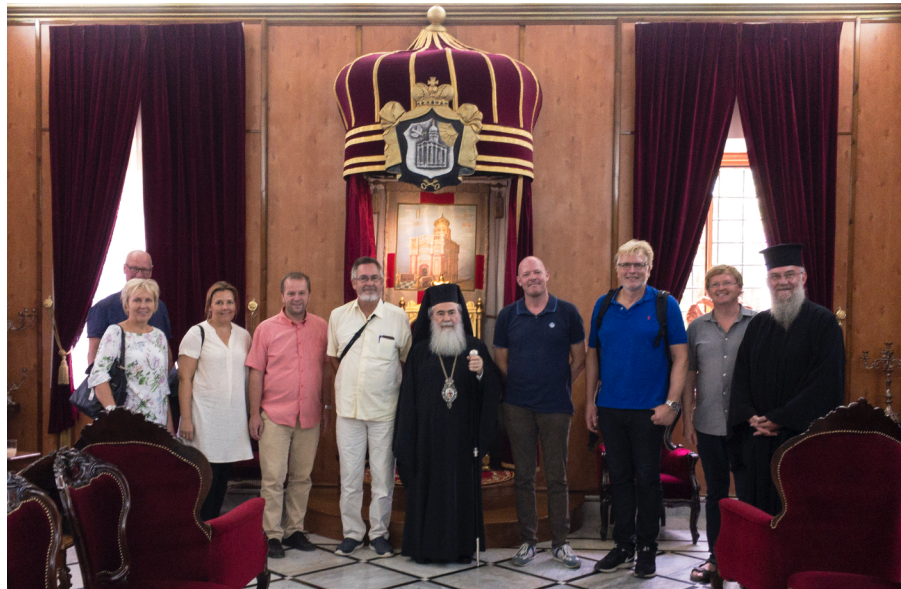
På audiens hos patriark Teofilos i Jerusalem.

Første stopp var Nasaret som var Jesu oppvekstby. På vei dit skulle vi ta drosje, men før vi kom oss ut av flyplassen ble drosjen jeg satt i stoppet av politiet. Det viste seg at sjåføren ikke hadde de nødvendige papirer til å kjøre til og fra flyplassen. Etter mye om og menn kom vi oss til slutt til Nasaret. Der så vi utgraving av den eldste delen av Nasaret som viste hvordan det så ut på Jesus tid, og vi lærte om bakgrunnen