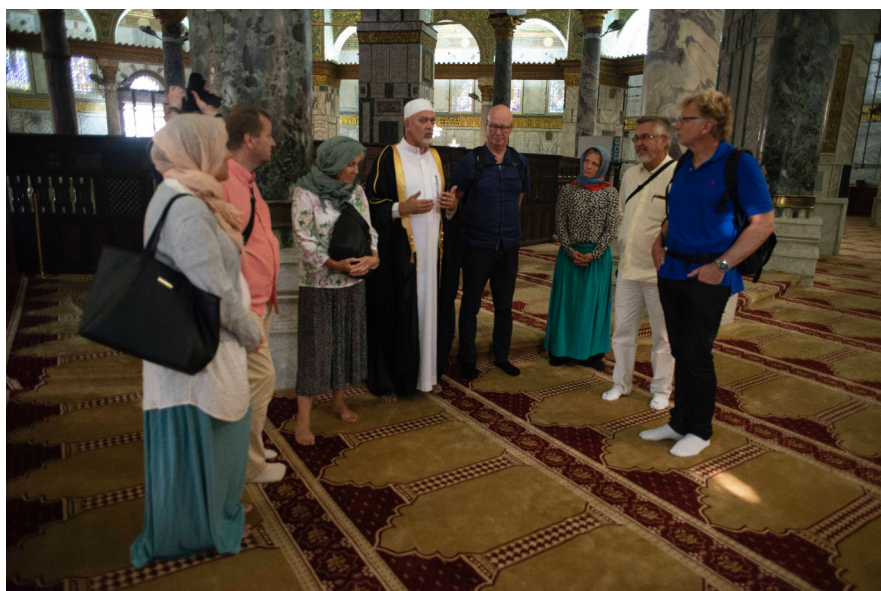
Omvisning i Klippemoskeen av en professor i muslimsk teologi.

ved Genesaretsjøen finner vi flere kjente plasser. På Saligprisningenes berg finner man en hage med kirke og kloster som inngir til fred og ettertanke. Der finner vi stedet hvor man tenker seg at Jesus holdt bergprekenen og nede ved sjøen stedet der Jesus møtte disiplene etter sin oppstandelse i følge Johannesevangeliet. Der på stranden rigget vi oss til og holdt nattverdsgudstjeneste. Da vi var ferdig kom en meget sint mann som mente vi hadde tatt oss til